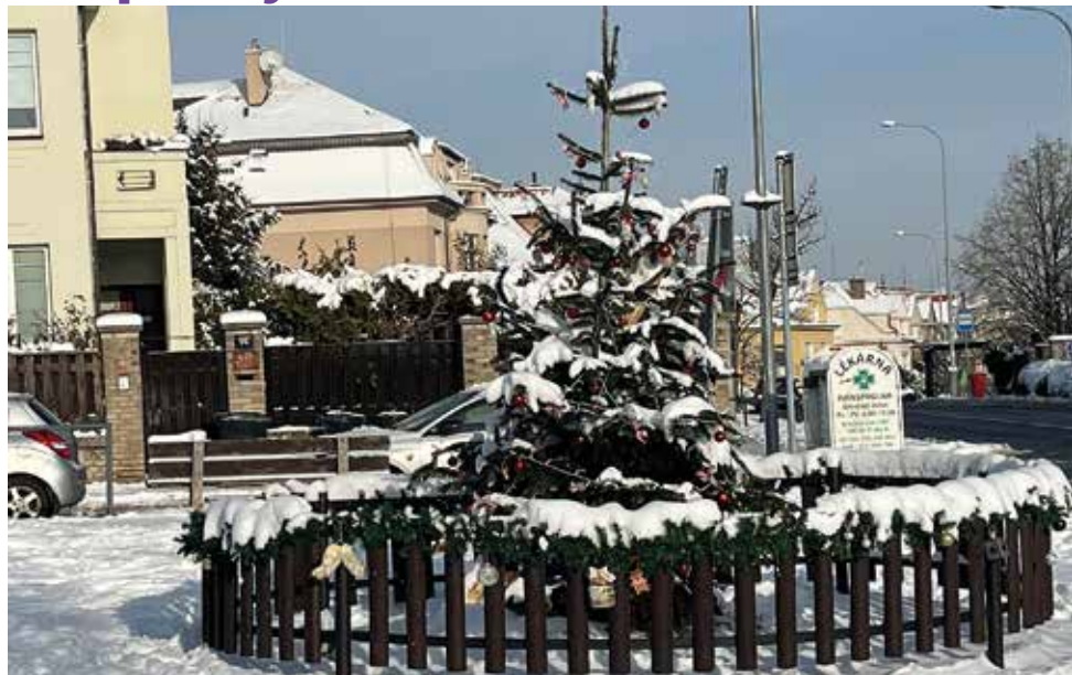
Strom č.2 2023