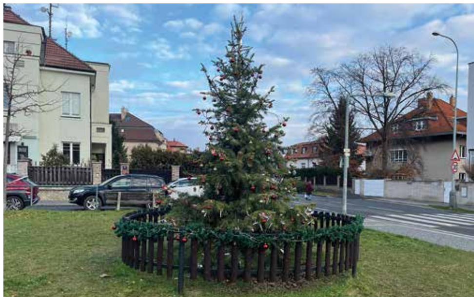
Strom č. 3 2024